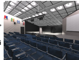
Et av flere forslag

Vi rev ned veggen i møtesalen nå i august, da vi skal bygge en dobbelt så stor møtesal, med plass til ca. 180 personer. Vi er i planleggingsfasen nå. Alle kan bidra: Penger, ideer, arbeidere trengs!